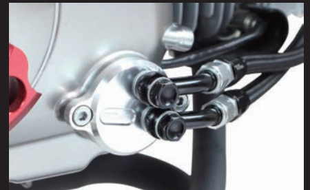
装着写真(オイル取り出し口)