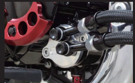
装着写真(オイル取り出し口)