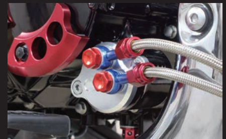
装着写真(オイル取り出し口)