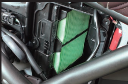
装着写真(ノーマルエアフィルター)