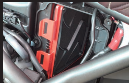
装着写真(SP武川製パワーフィルター)