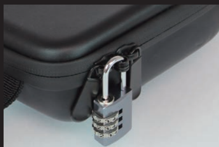
2つのファスナータブを合わせ、鍵を取り付けることで、簡易的な防犯対策が可能になります。