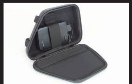
ETC本体をホールドする面ファスナー付きバンド付き。ケースの蓋側にはメッシュポケット付き。