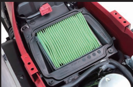
装着写真(ノーマルエアフィルター)