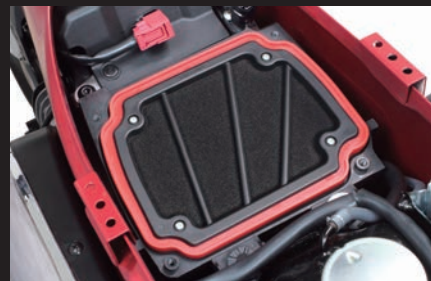
装着写真(SP武川製パワーフィルター)