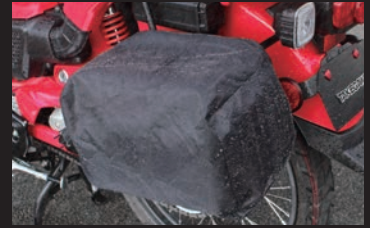
レインカバー付属 巾着タイプで簡単に取り付け可能