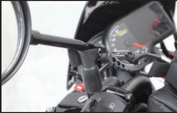
ミラーシャフトにナイロンベルト(フック付き)を装着し、フックをDリングに取り付け、バッグ本体のナイロンベルトでハンドルに固定。