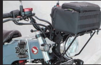
バッグ本体のナイロンベルトでSP武川製フロントキャリアに固定。ナイロンベルト(面ファスナー付き)をDリングに取り付け、固定補助。