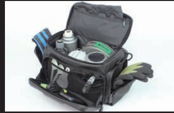
コンパクトながら大容量 ソロキャンプグッズの収納が可能