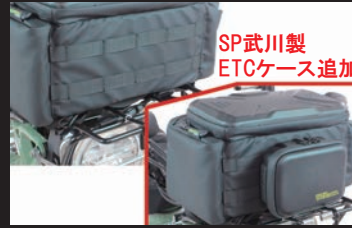
モールシステムを採用 バッグなどの追加も行えます。