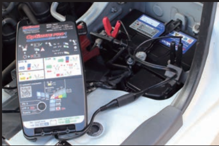
バッテリークリップによる充電器接続