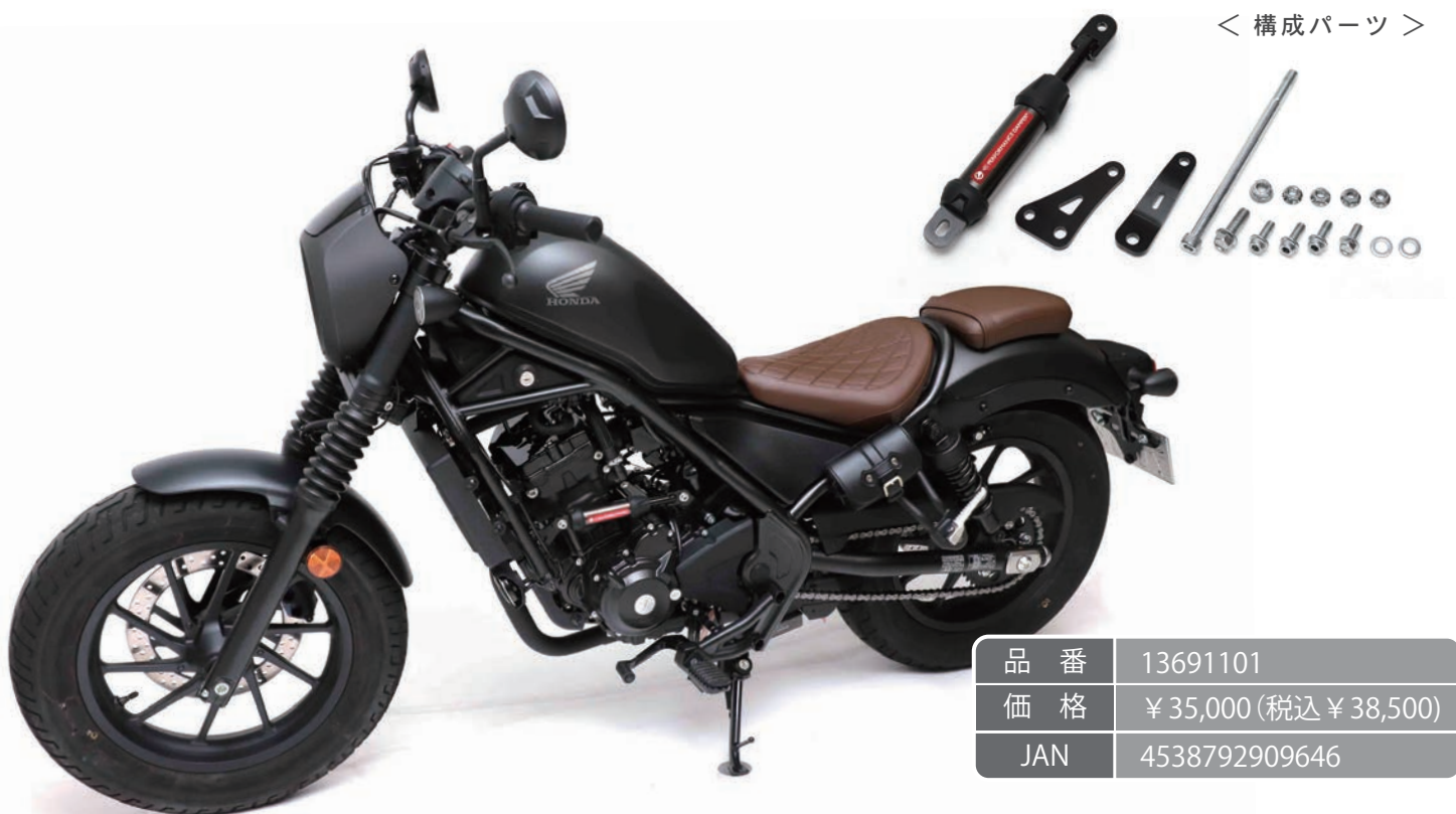
< 構成パーツ >

微振動やたわみを素早く吸収してハンドリングを向上させ、 特にツーリングなどの長距離移動で効果を発揮する車種専用車体制振ダンパー。 専用ステーで車体フレームに装着することで、ワンランク上の上質な乗り心地を提供します。