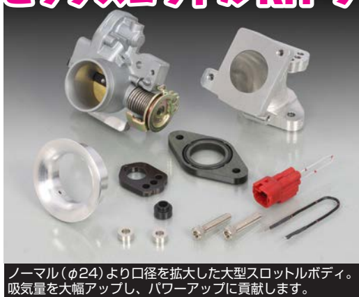
ノーマル(φ24)より口径を拡大した大型スロットルボディ。吸気量を大幅アップし、パワーアップに貢献します。