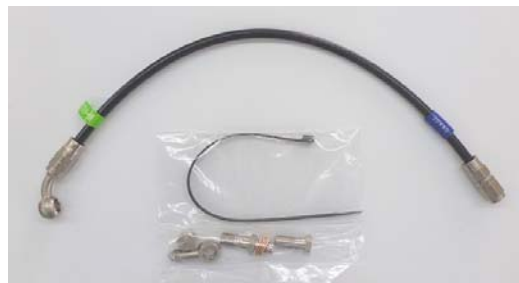
(株)プロト社製 SWAGE-LINE (BEET 専用品) が付属となっています。

品番 0111-KF7-20 (シルバー)固定式 税別価格 ¥74,000- JANコード 4582346467137