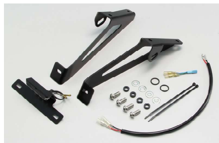
HA6664 ¥13,750 【¥12,500】