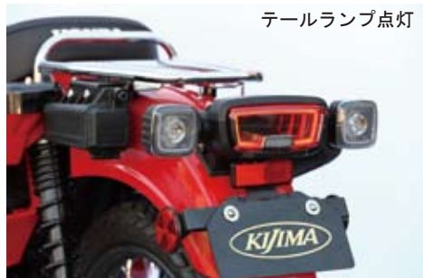
テールランプ点灯