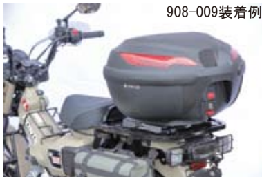
JMS社一七式特殊荷箱装着例