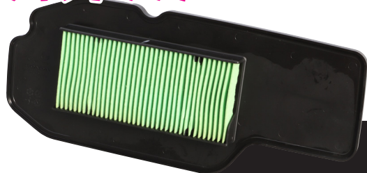
ノーマルエアークリーナーの補修用エアエレメントです