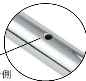
アクセル側/クラッチ側 穴あけ加工済