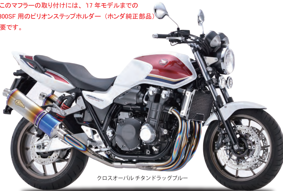
クロスオーバー チタンドラッグブルー

注※このマフラーの取り付けには、'17 年モデルまでの CB1300SF 用のピリオンステップホルダー（ホンダ純正部品） が必要です。