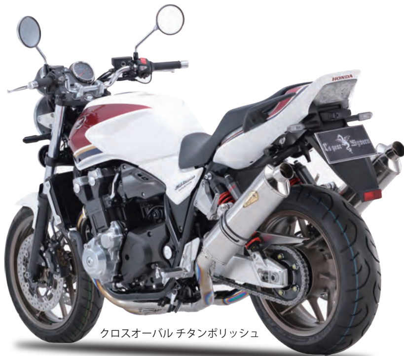
クロスオーバー チタンポリッシュ