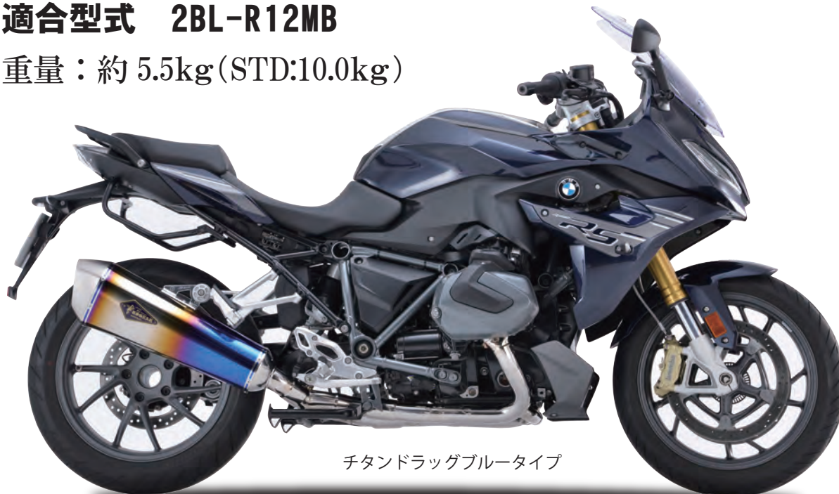
チタンドラッグブルータイプ