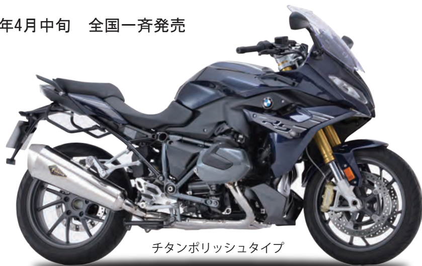
チタンポリッシュタイプ