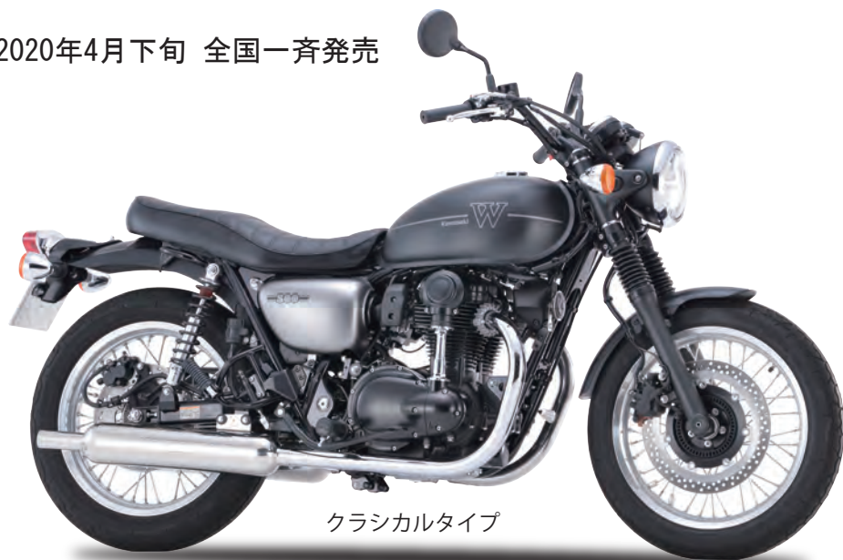
クラシカルタイプ