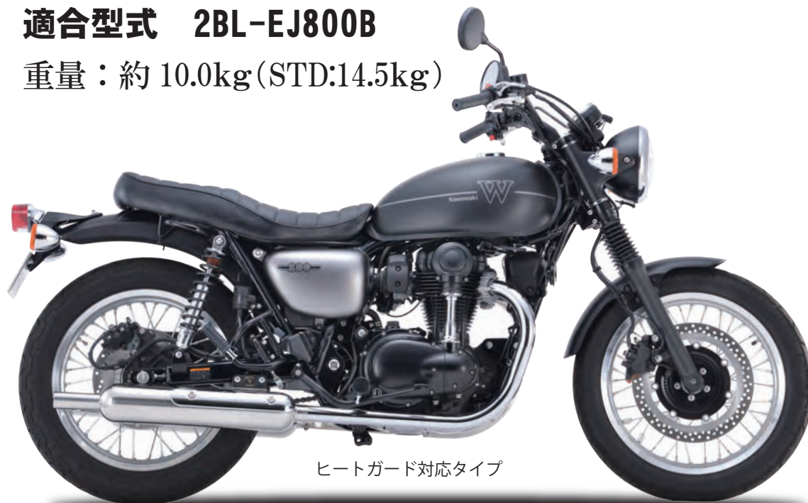
ヒートガード対応タイプ