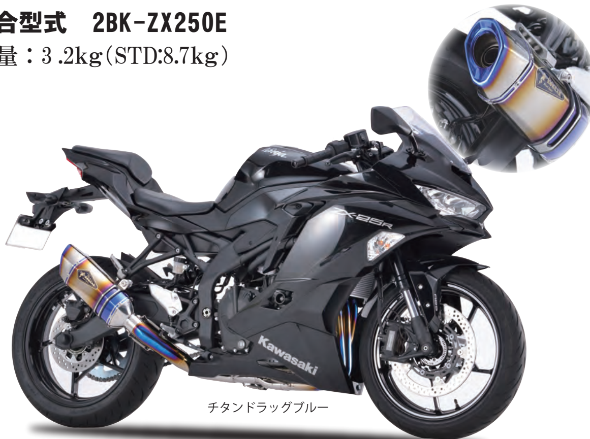
チタンドラッグブルー