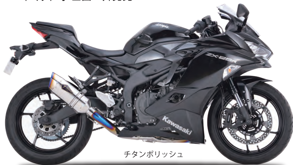
チタンポリッシュ