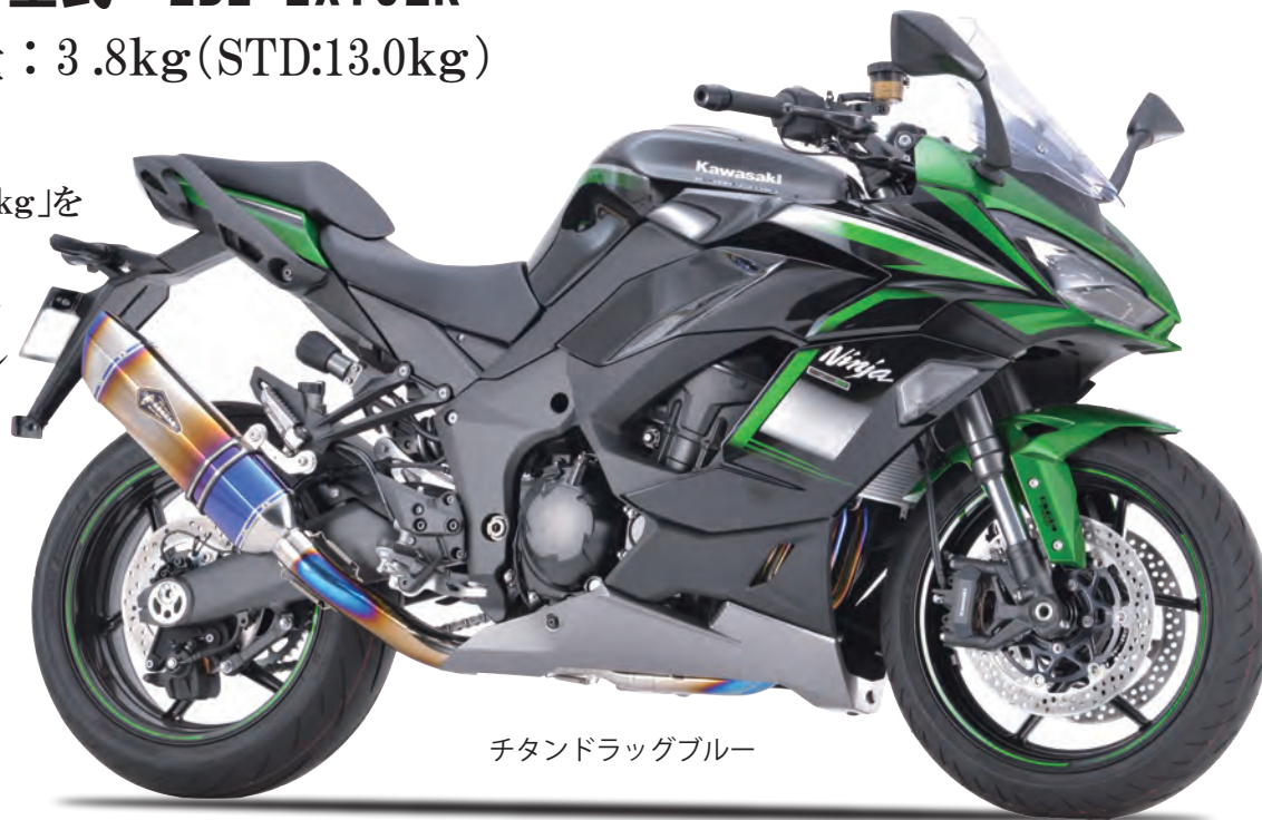
チタンドラッグブルー