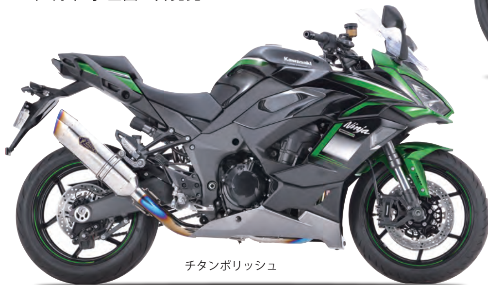
チタンポリッシュ