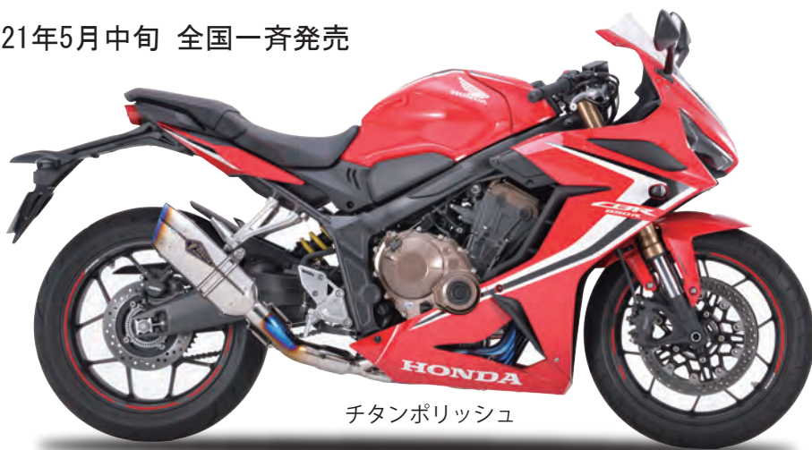
チタンポリッシュ