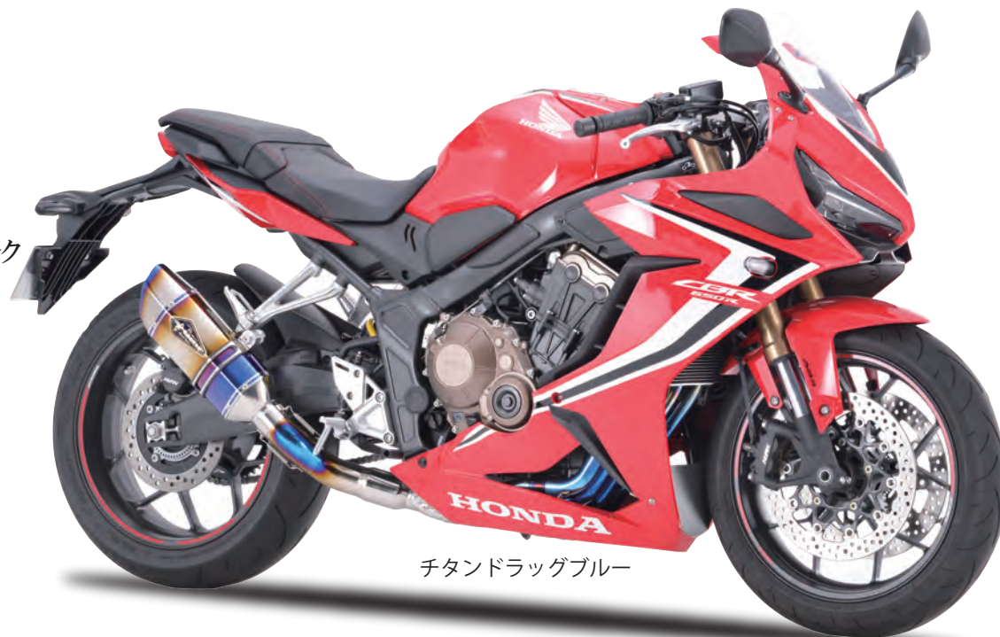
チタンドラッグブルー