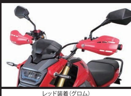
レッド装着(グロム)