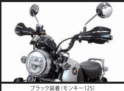
ブラック装着(モンキー125)