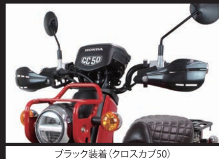
ブラック装着(クロスカブ50)