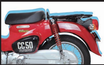
装着クロスカブ50(シート高:約25mmダウン)