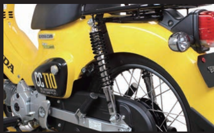
装着 (クロスカブ110/ブラック塗装)