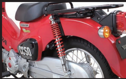
装着 (クロスカブ50/レッド塗装)

※ローダウンリアショックアブソーバーを装着した場合、マフラーと地面の距離が近くなります。カーブや段差等通過時にマフラーが地面と接触する恐れがあるので、注意して下さい。 ※ローダウンリアショックアブソーバーを装着した場合、センタースタンドを掛けるのが純正時よりも重くなります。予めご了承下さい。