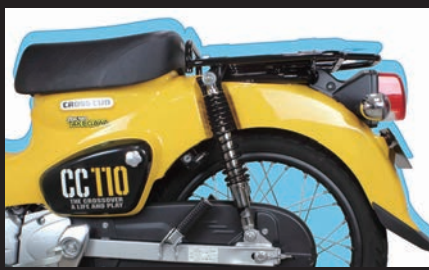
装着クロスカブ110(シート高:約25mmダウン)