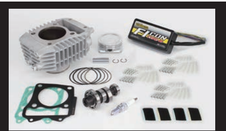
Sステージαポアアップキット181cc