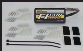
FIコンTYPE-e(インジェクションコントローラー)