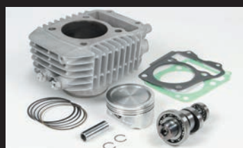
Sステージボアアップキット181cc

■SステージαボアアップキットはSステージボアアップキットにFIコン TYPE-e(インジェクションコントローラー)、フューエルインジェクター、スパークプラグが付属しています。