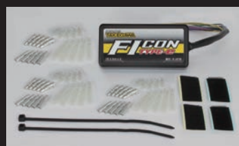
FIコン TYPE-e(インジェクションコントローラー)