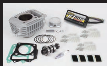
Sステージαボアアップキット181cc