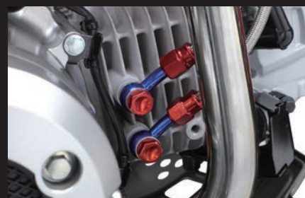
装着写真(オイル取り出し口)