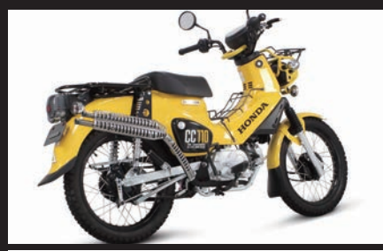
装着写真(クロスカブ110(JA45))