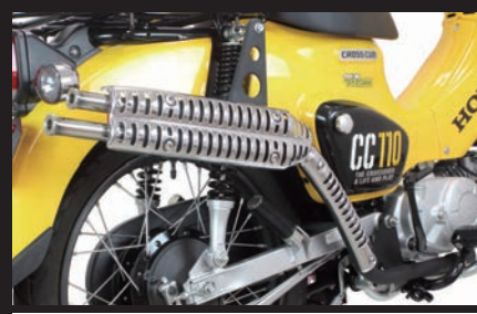
装着写真(クロスカブ110(JA45))