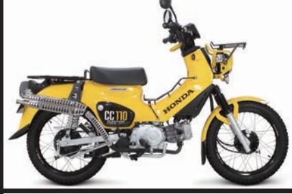
装着写真(クロスカブ110(JA45))