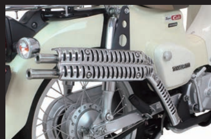
装着写真(スーパーカブ110(JA44))