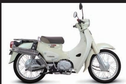
装着写真(スーパーカブ110(JA44))