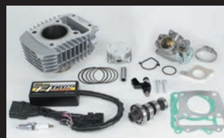
ハイパーeステージボアアップキット143cc