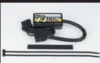
FIコンTYPE-e(インジェクションコントローラー)