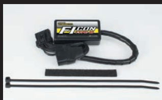
FIコンTYPE-e(インジェクションコントローラー)