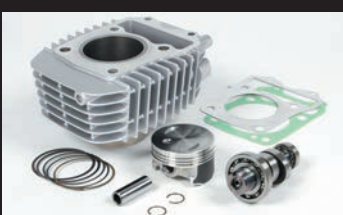
eステージボアアップキット143cc