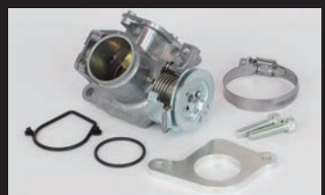
ビッグスロットルボディーキット