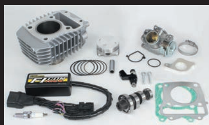
ハイパーeステージボアアップキット143cc